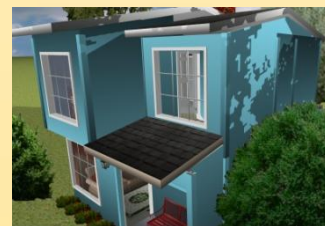
Modelos en 2 Plantas