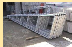
Cerchas en metal