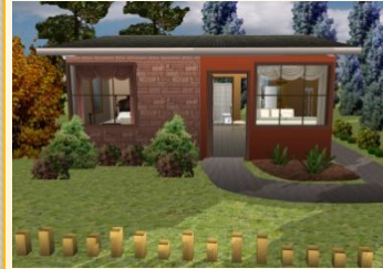
Diseño en 3D

NOTA: IDECASA brinda servicio de diseño y asesoría en caso de diseños propios y diseños de fachada para casas típicas.